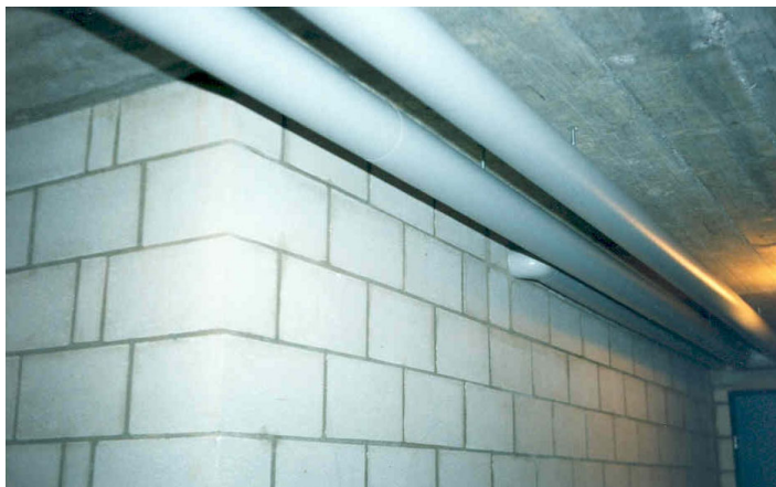
Bild 2: Rohrleitungsanlage mit Isolierummantelung „ISOGENOPAK 350 SE“ (Baustoffklasse B1) auf nichtbrennbaren Dämmstoffen in einem Kellerraum

Eine wesentliche Anforderung ist, dass alle Rohrleitungsanlagen im Bereich von Wänden und Decken mit Anforderungen an die Feuerwiderstandsdauer (F 30 bis F 90) nach den Anforderungen der baurechtlich eingeführten Leitungsanlagen-Richtlinien abgeschottet werden müssen.