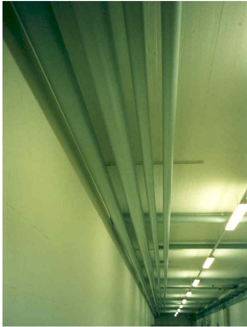
Bild 3: Rohrleitungsanlage mit Isolierummantelung „ISOGENOPAK 350 SE“ (Baustoffklasse B1) auf nichtbrennbaren Dämmstoffen in einem Kellergang / -flur