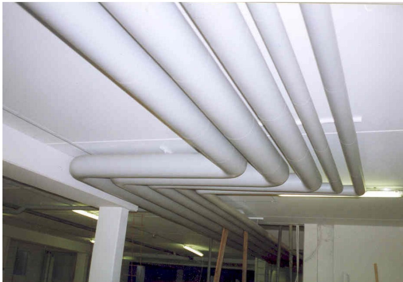
Bild 4: Rohrleitungsanlage mit B1-Isolierummantelung in einer Tiefgarage

Die Verwendung von brennbaren Dämmstoffen und Isolierummantelungen ist in Mittel- und Großgaragen zulässig, wenn die Baustoffklasse B2 eingehalten wird.